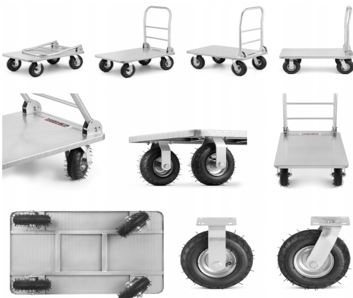
Stavba plošinového vozíku