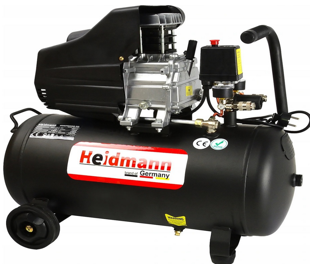
OLEJOVÝ KOMPRESOR KOMPRESOR 50L 8bar HEIDMANN H00721

Jeden z nejvýkonnějších 50litrových kompresorů dostupných na trhu!